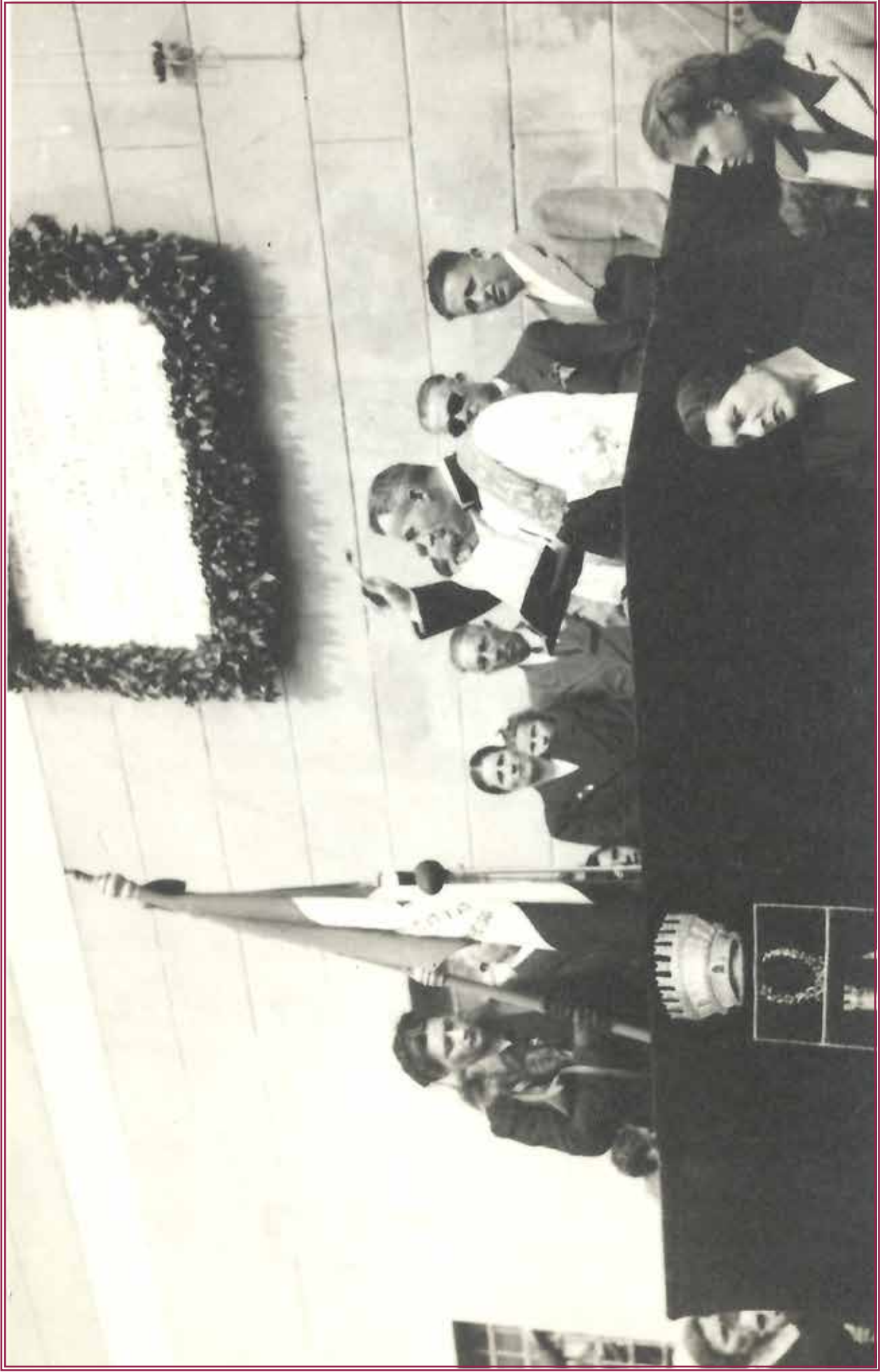
Aprile 1946: Anniversario della Liberazione. Inaugurazione della lapide posta sul fianco del vecchio Municipio.