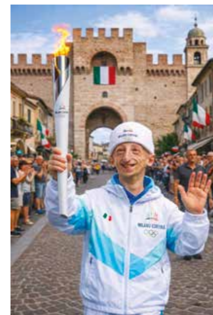
La foto realizzata con AI che ritrae Sammy Basso in tenuta Olimpica.

Tutti abbiamo seguito gli eventi che hanno preceduto l'apertura delle Olimpiadi Milano-Cortina 2026 e le gare successive. Il passaggio dei tedofori per città e paesi, ha suscitato l'emozione collettiva che si accende quando una fiamma passa di mano in mano e diventa entusiasmo condiviso. Tra tante foto reali, una in particolare - curiosamente non autentica - mi è rimasta impressa nella memoria. Non amo le immagini generate con l'intelligenza artificiale: sono fredde, costruite, troppo perfette. Eppure quella in cui Sammy Basso indossa la tuta bianca ufficiale dei tedofori e corre dentro le mura di Cittadella con la torcia in mano l'ho voluta salvare e riproporre qui. Quella circostanza non è mai accaduta ma proprio per questo l'immagine sorprende: non appare come una forzatura o un artificio, ma come qualcosa di plausibile. Sammy sembra vivo, presente, con il suo sorriso inconfondibile e quella gioia di vivere che trasmetteva con naturalezza. Guardandola, si ha quasi l'impressione di assistere a un evento al quale avrebbe potuto tranquillamente partecipare davvero. Forse per questo quell'immagine colpisce più di altre: non racconta ciò che è stato, ma ciò che sentiamo possibile. Sammy come tedoforo appare perfettamente coerente con quello che lui ha rappresentato per molti: un simbolo di energia, determinazione, fede e fiducia nella vita. La torcia olimpica, che significa continuità e consegna di