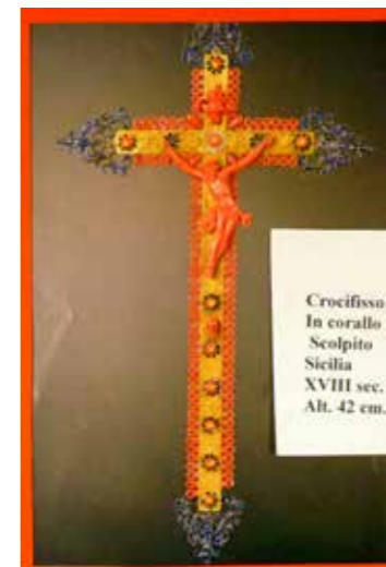
Crocifisso In corallo Scolpito Sicilia XVIII sec. Alt. 42 cm.