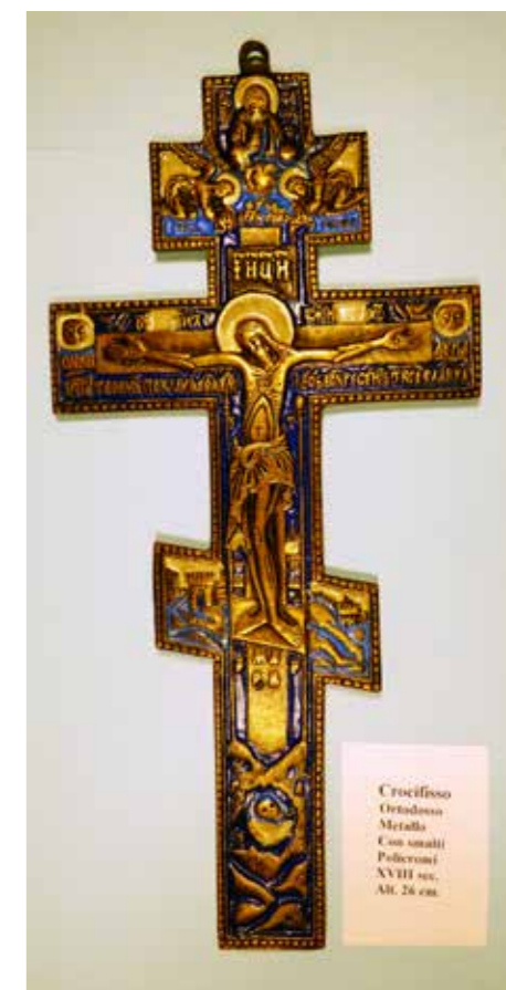
Crocifisso Ortodosso Marmo Con smalti Polliccioni XVIII sec. Alt. 26 cm.

come il corallo, utilizzato soprattutto nel Regno delle Due Sicilie.