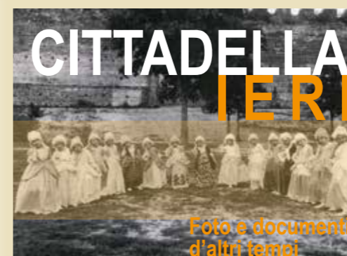
Foto e documenti d'altri tempi